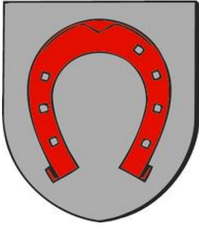
Commune de Brunstatt